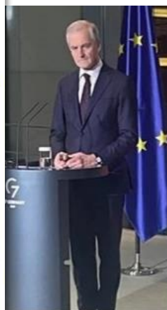
Jonas Gahr Støre og Tysklands forbundskansler Olaf Scholz i statsministerens kontor