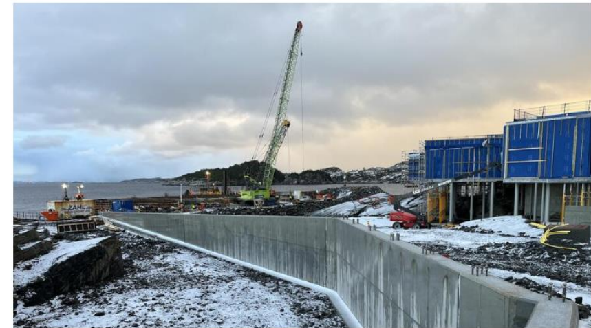
Das „Northern Lights“-Projekt zur CO 2 -Speicherung in Norwegen

Eine ähnliche Infrastruktur für die CCS-Technologie soll auch in Deutschland aufgebaut werden.