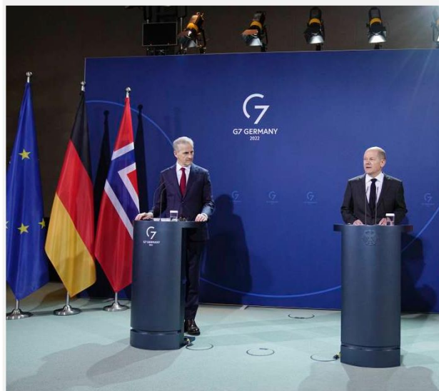
Statsministrene Jonas Gahr Støre og Olaf Scholz fremhevet det gjensidig gode forholdet mellom Norge og Tyskland.