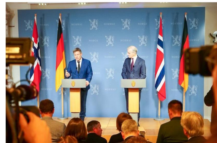
Møte mellom den tyske økonomi- og klimaministeren Robert Habeck og Norges statsminister Jonas Gahr Støre i januar 2023.